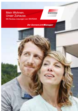
Lösungen für den Neubau

In unseren weiteren Broschüren erfahren Sie noch mehr zu Lösungen und Produkt-Highlights von WAREMA. Einfach herunterladen oder anfordern unter www.warema.de .