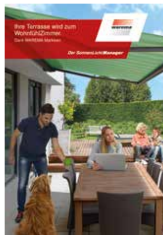
Lösungen für die Terrasse