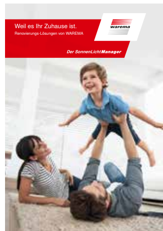
Lösungen für die Renovierung